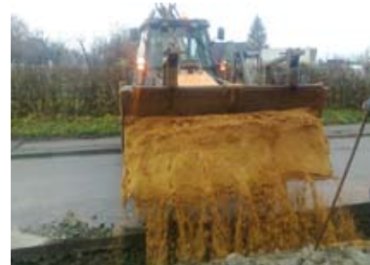
Budowa kanalizacji na ul. Puńcówskiej.