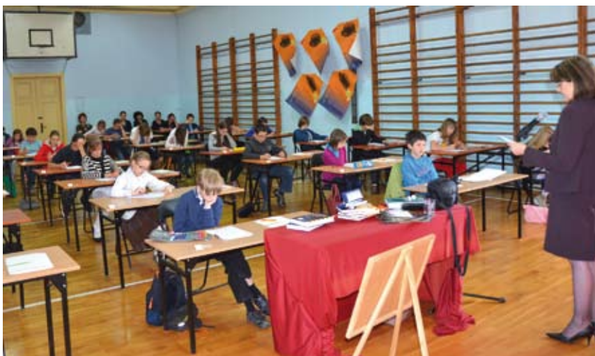
W Cieszyńskim Konkursie Ortograficznym wzięło udział 32 reprezentantów z ośmiu szkół podstawowych.

W szranki stanęło łącznie 32 reprezentantów z ośmiu cieszyńskich szkół