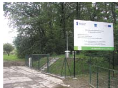
Tłocznia ścieków na ul. Jastrzębiej.

DLA ROZWOJU INFRASTRUKTURY I ŚRODOWISKA Projekt współfinansowany przez Unię Europejską ze środków Funduszu Spójności w ramach Programu Infrastruktura i Środowisko