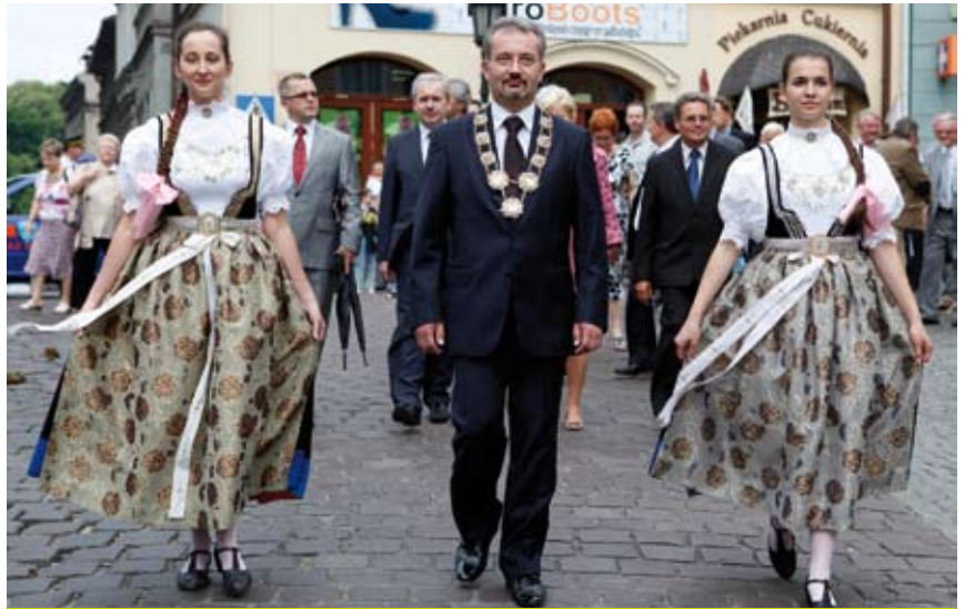
Święto Trzech Braci rozpocznie się tradycyjnym pochodem i spotkaniem władz obu Cieszynów na Moście Przyjaźni.