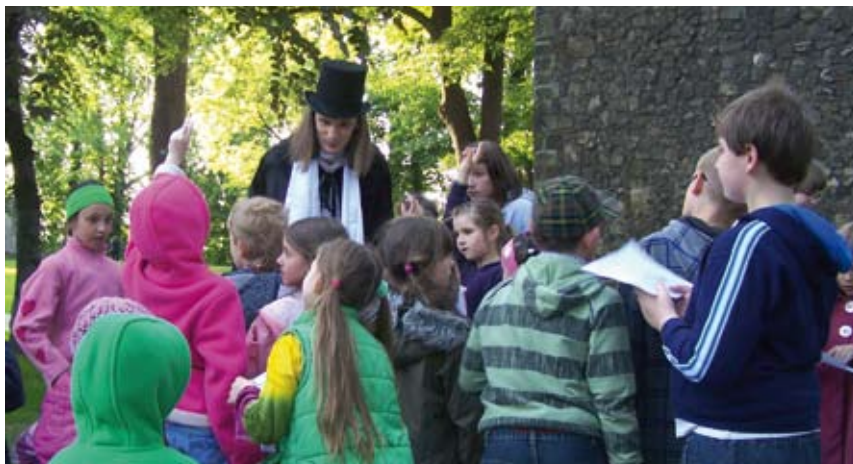
Zajęcia z najwierniejszymi, młodymi czytelnikami prowadził... Hans Christian Andersen.