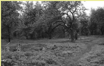
Działka na sprzedaż przy ul. Stokrotek.

Burmistrz Miasta Cieszyna informuje, że przeznaczono do sprzedaży w drodze ustnego przetargu ograniczonego do właścicieli nieruchomości przyległych działkę nr 3/340 obr. 69 o powierzchni 0,0438 ha położoną w Cieszynie przy ulicy Stokrotek obj. KW nr BB1C/00054306/6 Sądu Rejonowego w Cieszynie.