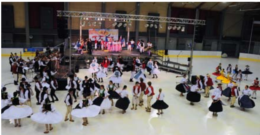
Zwieńczeniem festiwalu był finał taneczny opracowany na wszystkie zespoły.