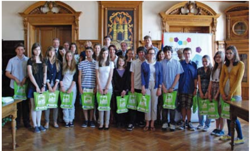
Na zdjęciu laureaci i finaliści konkursów przedmiotowych z Gimnazjum nr 1 wraz z nauczycielami i władzami miasta.