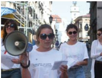
Każdy może dołączyć do grona Transgranicznego Centrum Wolontariatu.

„Mamy już pierwsze autorskie narzędzia jak design thinking. Rozpoczynamy również naukę języka czeskiego.” - za-