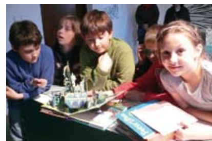
„Wow!” – rozbrzmiewa od tygodnia w zamkowej Basteji, gdzie są pokazywane książki Roberta Sabudy.

„Wow!” – rozbrzmiewa od tygodnia w zamkowej Basteji. Tak najczęściej reagują dzieci, oglądające wystawę „Książka z bajki / bajka z książki”. Prezentowane na niej książki Roberta Sabudy robią też wrażenie na dorosłych.