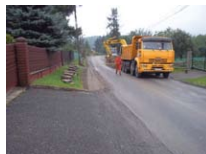
Budowa kanalizacji na ul. Puńcówskiej.