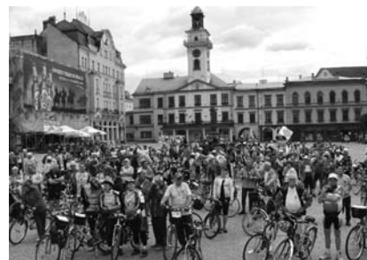
Na rajd rowerowy dla całej rodziny zapraszamy 17 czerwca.

Turystyczny Klub Kolarski PTTK „Ondraszek” serdecznie zaprasza na XV JUBILEUSZOWY CIESZYŃSKI RODZINNY RAJD ROWEROWY Cieszyn – Golezów .