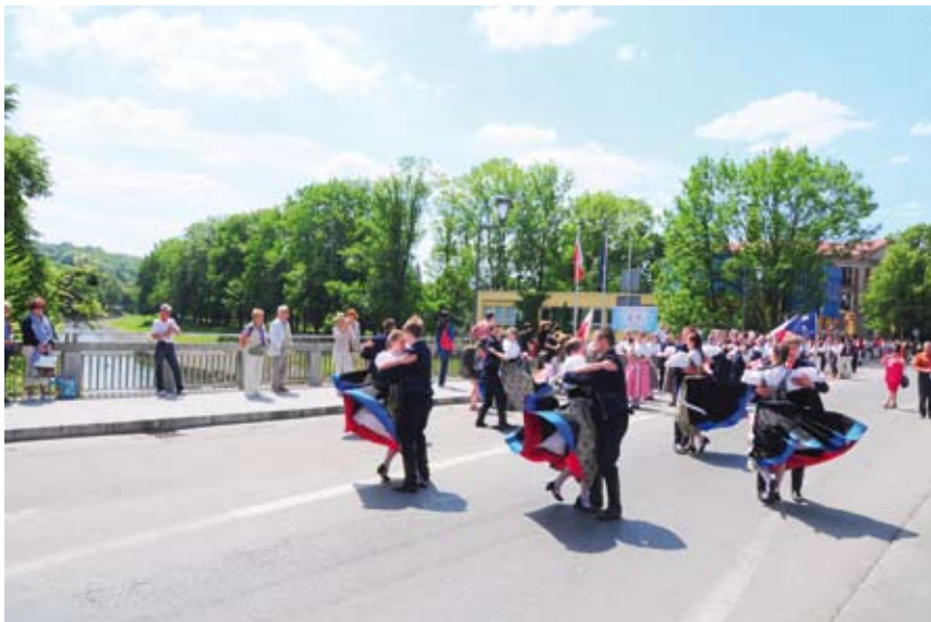
Rozśpiewany i roztańczony korowód ruszył z Czeskiego Cieszyna na Rynek po drugiej stronie Olzy.