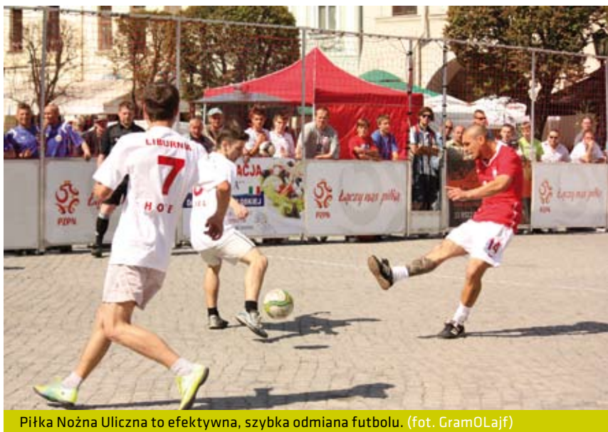
Piłka Nożna Uliczna to efektywna, szybka odmiana futbolu.

Drugi dzień turniejów to festiwal Piłki Nożnej Ulicznej, z udziałem różnych grup i środowisk społecznych. Drużyny uczestniczące (wg losowania): Prawnicy, Strefa Wolności, Hotel Liburnia, Polska A (grupa A); Nauczyciele, Pracownia Projektowa Piotr Gorewoda, SM Cieszynianka, Polska B (grupa B); Policja, Księża i Ministranci, Sonea, GramOLajf (grupa C); Górno-